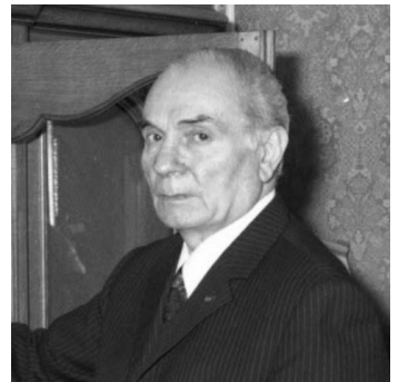
Étienne Gagnaire, maire de Villeurbanne de 1954 à 1977.