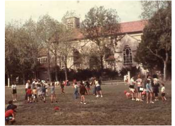
Terrain dans les années 60.

La photo aérienne montre le terrain tel qu'il était en 1962.