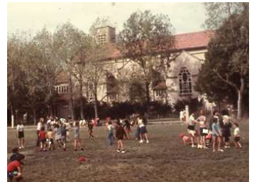
Terrain dans les années 60.

Dans les années 60-70, Villeurbanne a vu sa population augmentée et les promoteurs « lorgnaient » tous les espaces semi-agricoles ou jardins ouvriers.