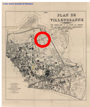
Carte de Villeurbanne en 1929-30