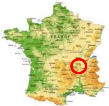
Carte de France

La photo aérienne montre le terrain tel qu'il était en 1962.